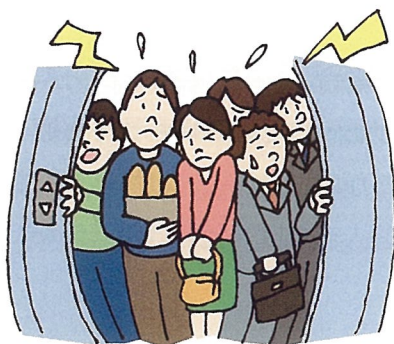
☆定員オーバーは事故のもと ☆二輪車の運搬禁止