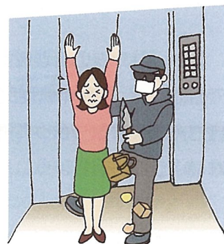
☆エレベーターは密室