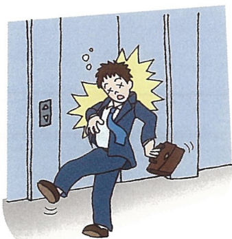
☆乱暴な扱いは事故のもと