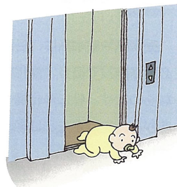
☆幼児ひとりでは危険がいっぱい