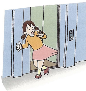
☆戸袋に引き込まれないように