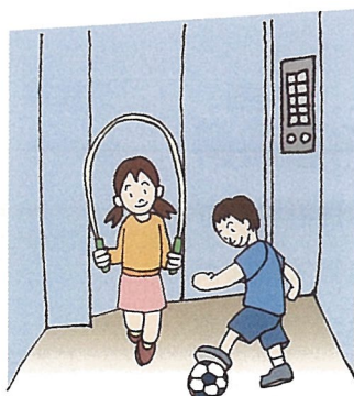
☆とんだり、はねたりは事故のもと