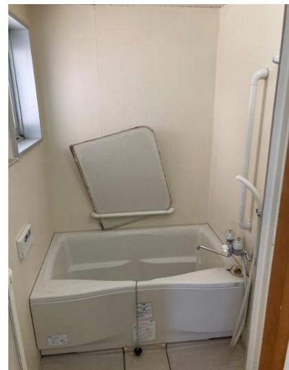
・諫早西部台団地は、お風呂「追い炊き」機能付