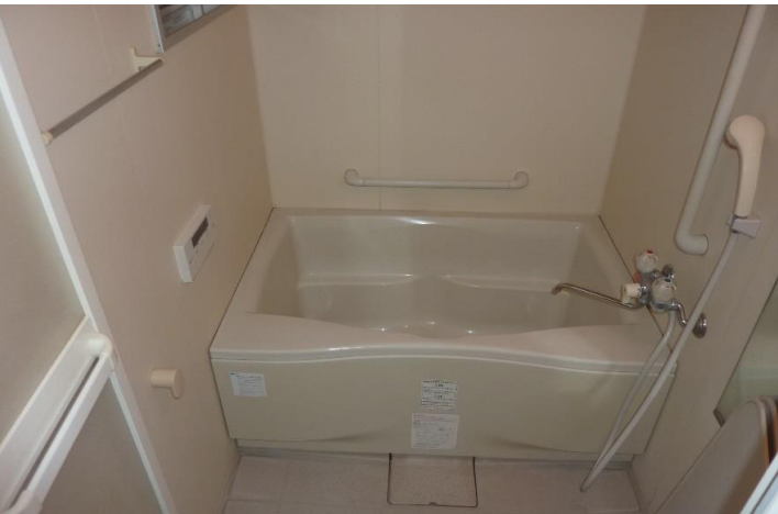
・諫早西部台団地は、お風呂「追い炊き」機能付